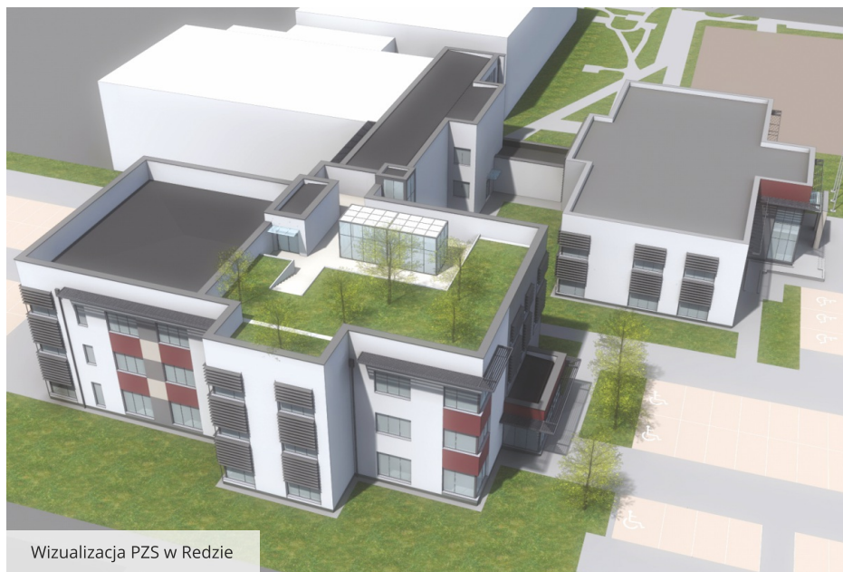
Wizualizacja PZS w Redzie

Podczas Powiatowej Inauguracji roku szkolnego 2024/2025 w PZS w Redzie odbyło się uroczyste podpisanie i wmurowanie aktu erekcyjnego pod budowę kompleksu 20 klasopracowni do przedmiotów zawodowych i ogólnokształcących. W nowoczesnym, trzykondygnacyjnym obiekcie, który zostanie połączony łącznikiem z budynkiem oddanym w 2019 r., znajdzie się także m.in. gabinet pedagoga, psychologa, doradcy zawodowego, stomatologa, a także biblioteka multimedialna i pokój nauczycielski. Z myślą o uczniach kierunku techniki architektury krajobrazu na dachu budynku powstanie zielony dach oraz przestrzeń, która zostanie efektywnie zagospodarowana. Powstanie laboratorium, szklarnia i pasieka, a na pozostałej części zostanie zainstalowana instalacja fotowoltaiczna.