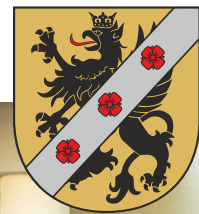
Radni Powiatu Wejherowskiego VII kadencji