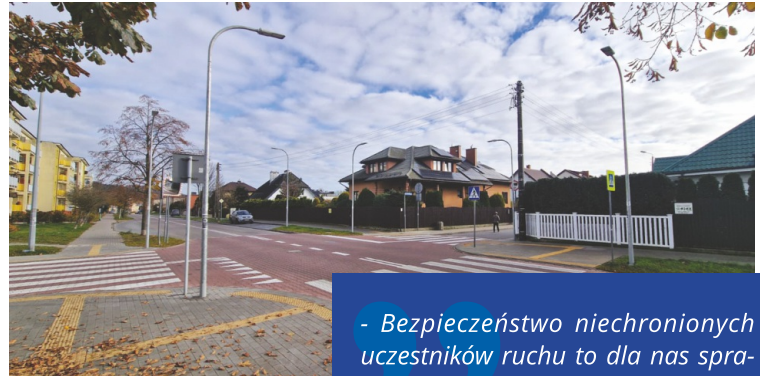
Wyniesione skrzyżowanie u zbiegu ulic Granicznej i Broniewskiego w Wejherowie

Zakończyły się prace remontowe na ulicy Granicznej w Wejherowie, które przyczynią się do poprawy bezpieczeństwa i ochrony pieszych uczestników ruchu. Inwestycja realizowana była przy wsparciu środków rządowych.