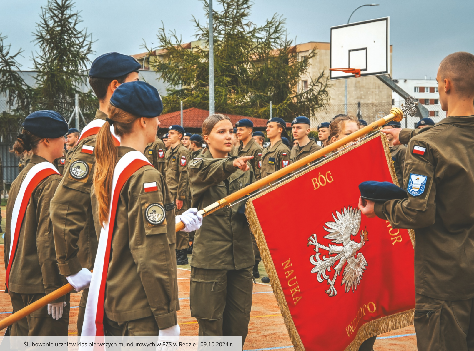
Ślubowanie uczniów klas pierwszych mundurowych w PZS w Redzie - 09.10.2024 r.