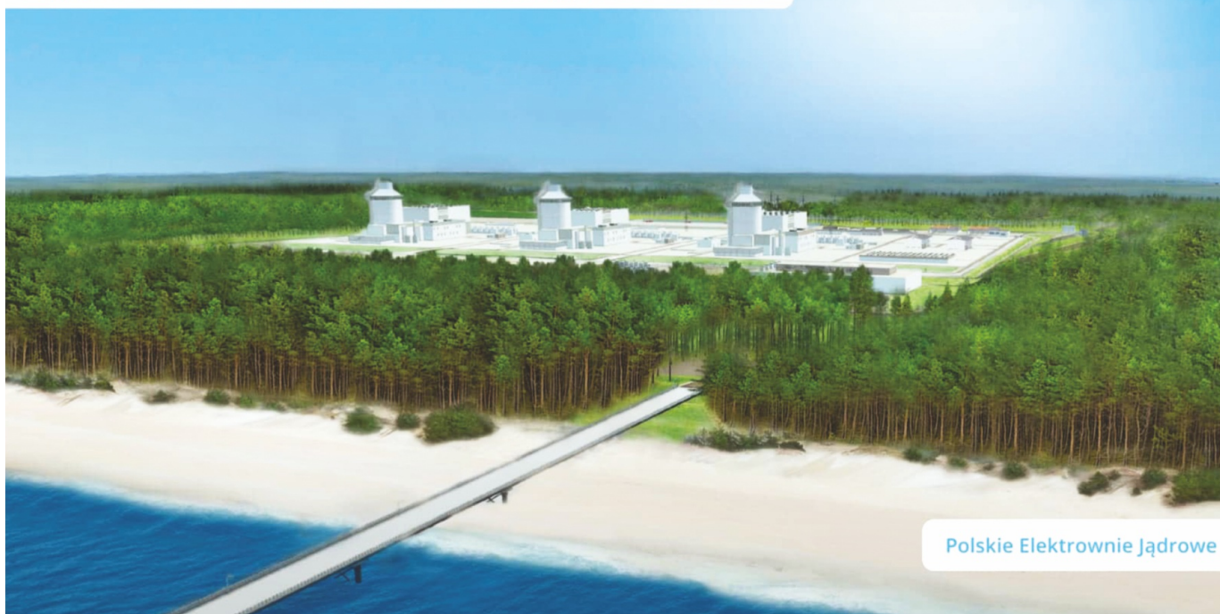
Poglądowa wizualizacja pierwszej elektrowni jądrowej w Polsce