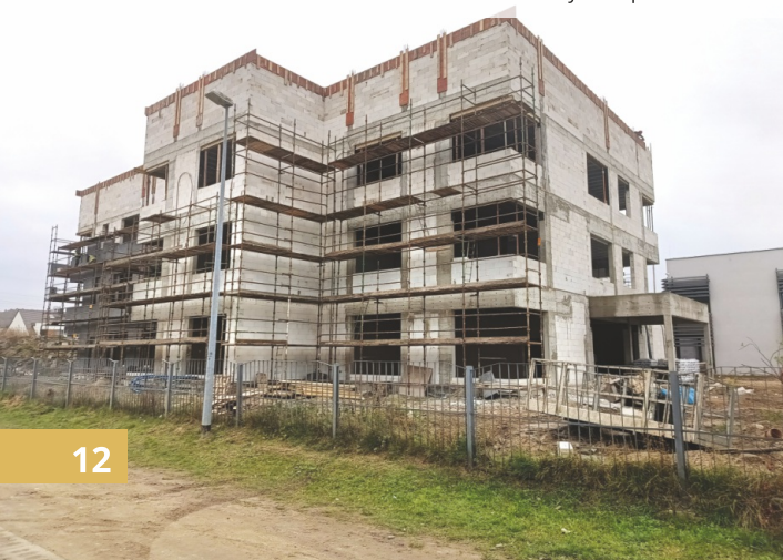
Obecny stan prac w Redzie

Koszt zadania to ponad 23 mln zł , z czego 20 mln zł stanowi dofinansowanie z Polskiego Ładu. Przewidywany czas zakończenia prac to koniec sierpnia 2025 r.