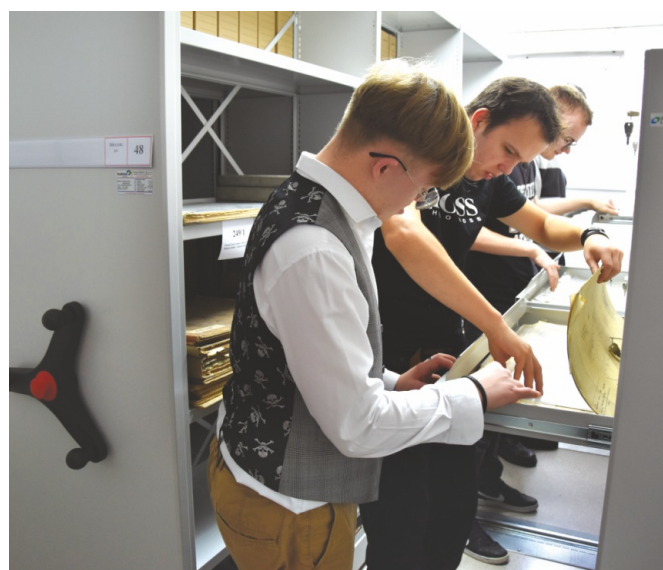
Uczniowie PZKS w Wejherowie podczas praktyk w zakładowym archiwum starostwa.