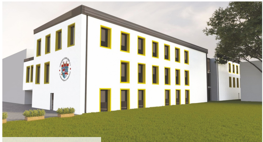
Wizualizacja PZS 4 w Wejherowie

W wyniku zadania powstanie trzykondygnacyjny budynek o powierzchni użytkowej ponad 2,6 tys. m 2 , w którym znajdzie się 15 w pełni wyposażonych sal dydaktycznych, w tym dodatkowe pracownie zawodowe branży mechanicznej i elektroenergetycznej, pomieszczenia sanitarne, gospodarcze, pokój nauczycielski, biblioteka oraz aula. Na dachu zostanie zamontowana instalacja fotowoltaiczna. Nowy budynek połą-