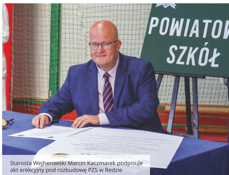
Starosta Wejherowski Marcin Kaczmarek podpisuje akt erekcyjny pod rozbudowę PZS w Redzie

W roku szkolnym 2024/2025 naukę w powiatowych szkołach rozpoczęło 8500 uczniów , z czego ponad 1300 to uczniowie klas pierwszych .