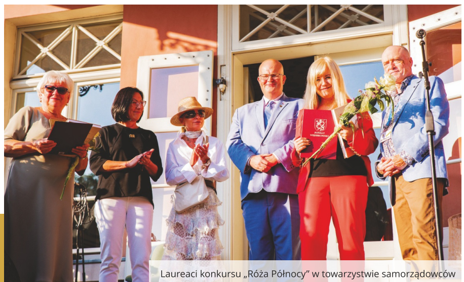
Laureaci konkursu „Róża Północy” w towarzystwie samorządowców

Zajmują się m.in. pomocą społeczną, wzbogacają ofertę kulturalną i sportową, popularyzują historię regionu oraz realizują zadania z zakresu profilaktyki zdrowotnej. Dnia 21 września w Parku Miejskim w Wejherowie przy Muzeum Piśmiennictwa i Muzyki Kaszubsko-Pomorskiej odbył się festyn, podczas którego wręczono nagrody w konkursie „Róża Północy” wyróżniającym się organizacjom pozarządowym z Powiatu Wejherowskiego.