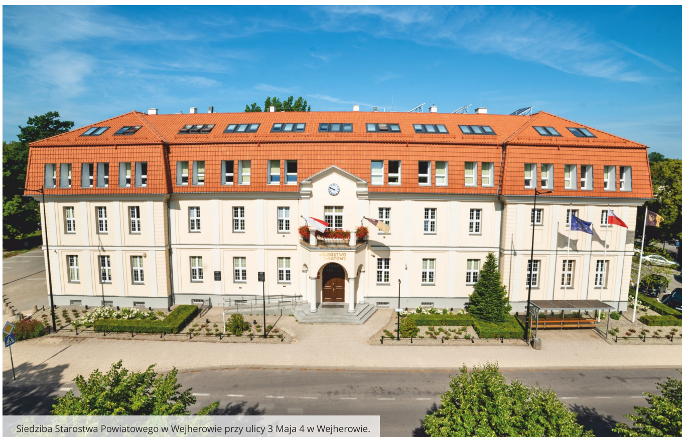
Siedziba Starostwa Powiatowego w Wejherowie przy ulicy 3 Maja 4 w Wejherowie.