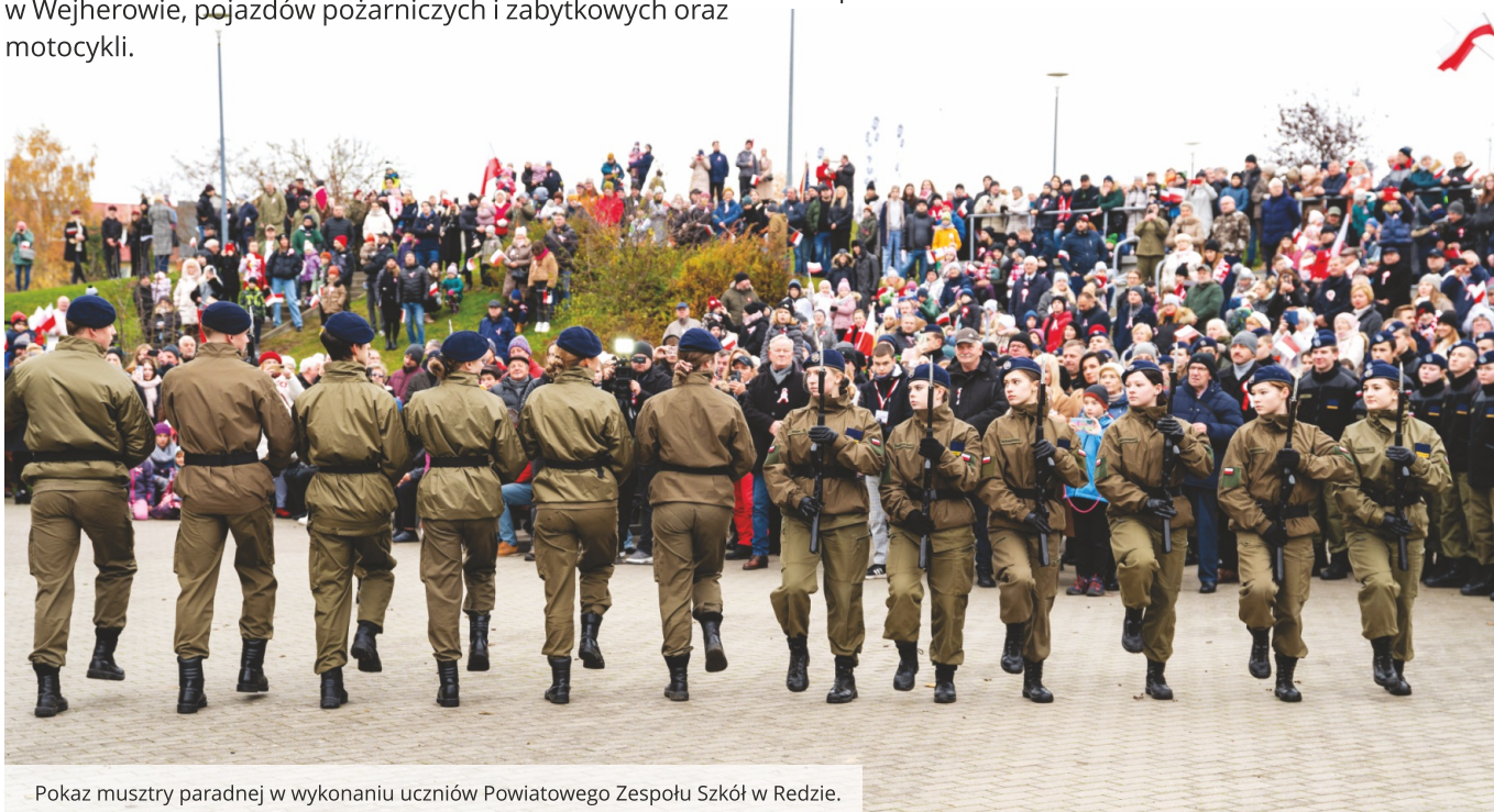
Pokaz musztry paradnej w wykonaniu uczniów Powiatowego Zespołu Szkół w Redzie.

Zwieńczeniem tego wyjątkowego dnia był koncert Zespołu „Last” - hard rock cover group. W Fabryce Kultury można było również wysłuchać wyjątkowego koncertu niepodległościowego „Rozumieć bohaterów Cezarego Paciorka z zespołem.