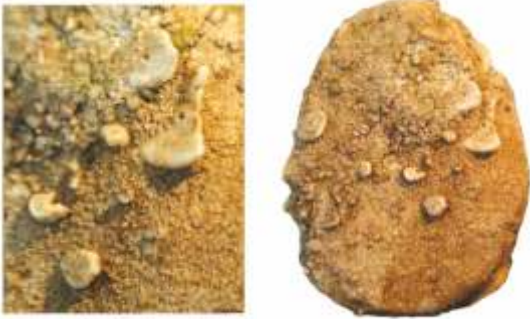
Liliowiec o dł. 3,5 cm, który został znaleziony w Luzinie. Fotografia przedstawia fragmenty okrągłych łodyżek (zwanymi również trochitami lub kolumnaliami). Okaz ma ponad 400 mln lat