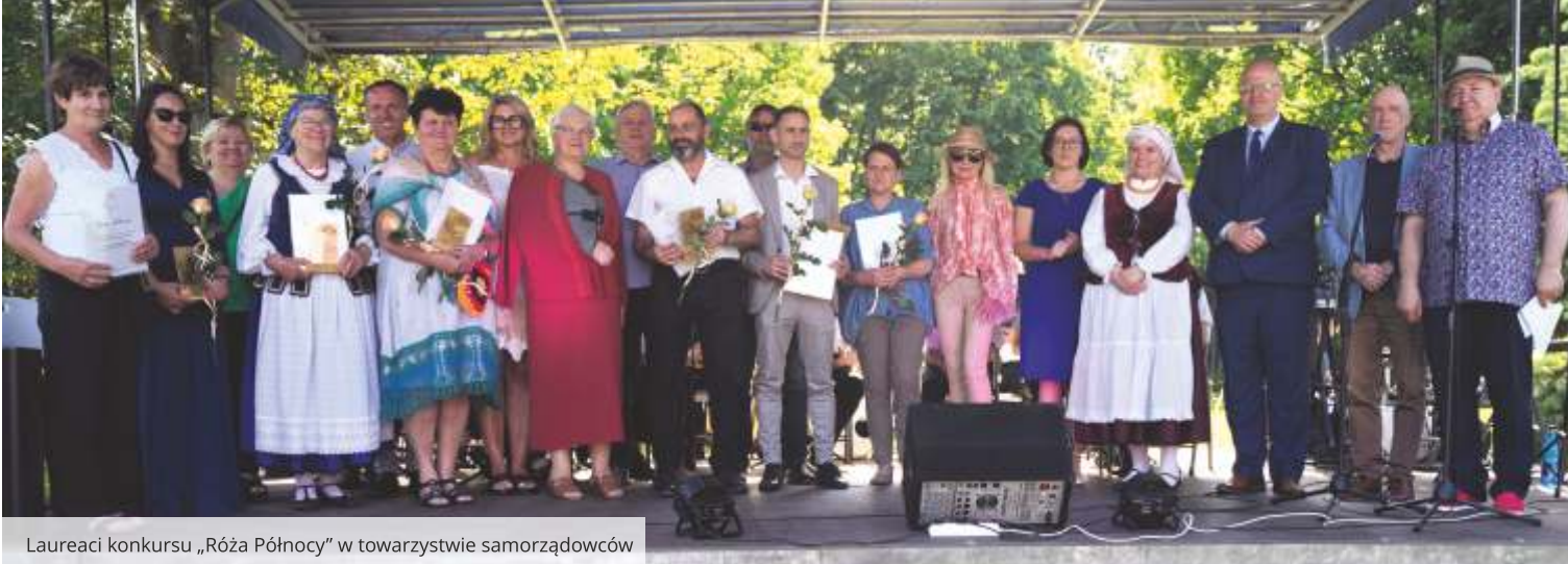
Laureaci konkursu „Róża Północy” w towarzystwie samorządowców

Podczas czwartej edycji konkursu „Róża Północy” wyróżniono osoby i organizacje pozarządowe, które z pasją i determinacją działają na rzecz lokalnych społeczności powiatu wejherowskiego.