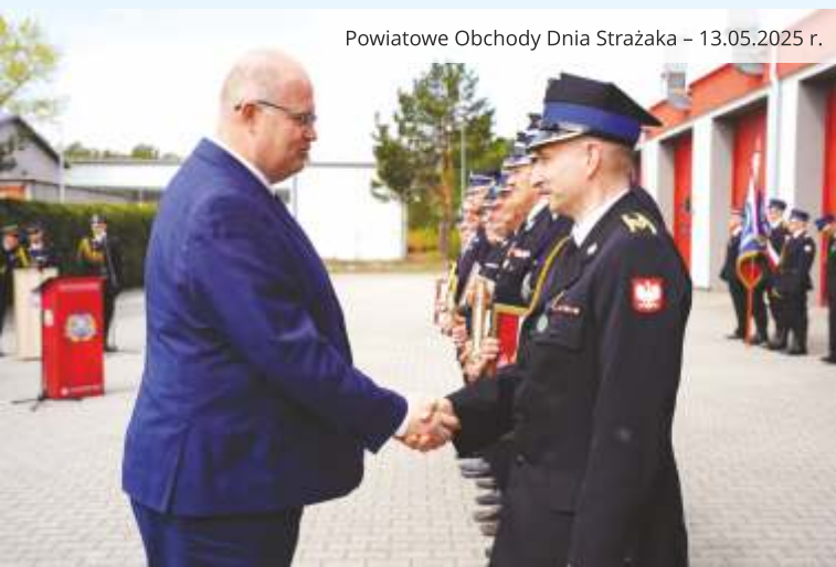
Powiatowe Obchody Dnia Strażaka – 13.05.2025 r.

Chciałbym także bardzo serdecznie podziękować Zarządowi Powiatu, Radzie Powiatu, wszystkim współpracownikom oraz pracownikom Starostwa Powiatowego w Wejherowie za miniony rok wspólnej, owocnej pracy. Wierzę, że razem możemy osiągnąć jeszcze więcej.