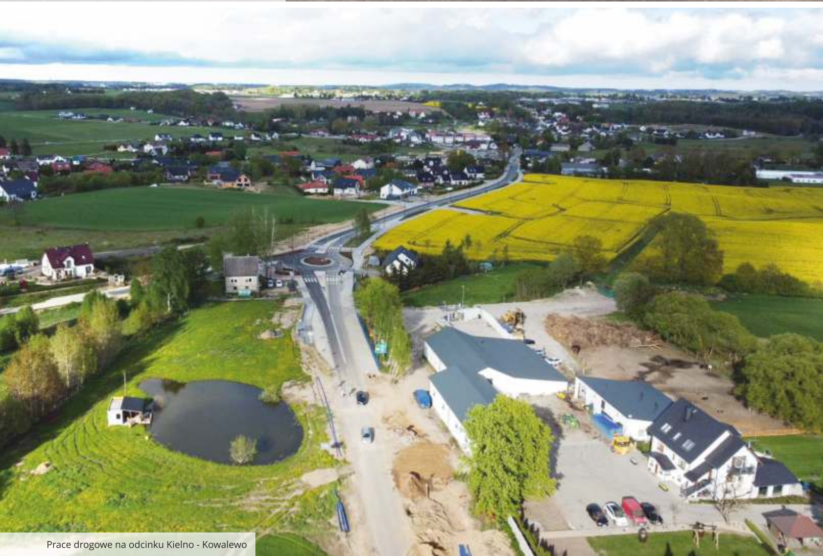
Prace drogowe na odcinku Kielno - Kowalewo