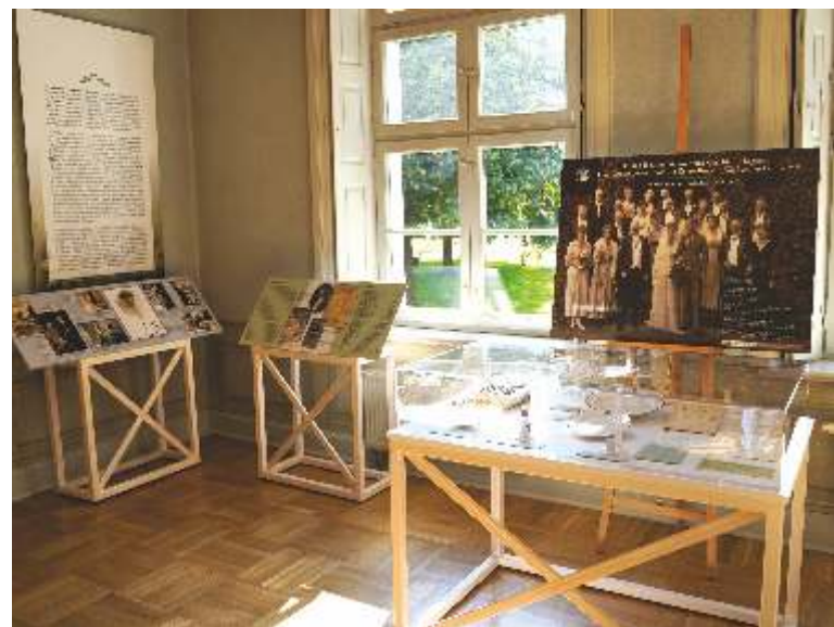
Wystawa dokumentująca dzieje rodu von Keyserlingk