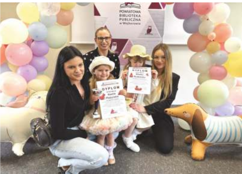
VIII Powiatowy Konkurs Recytatorski „Trudne wierszyki łamiące języki” – 02.06.2025 r.