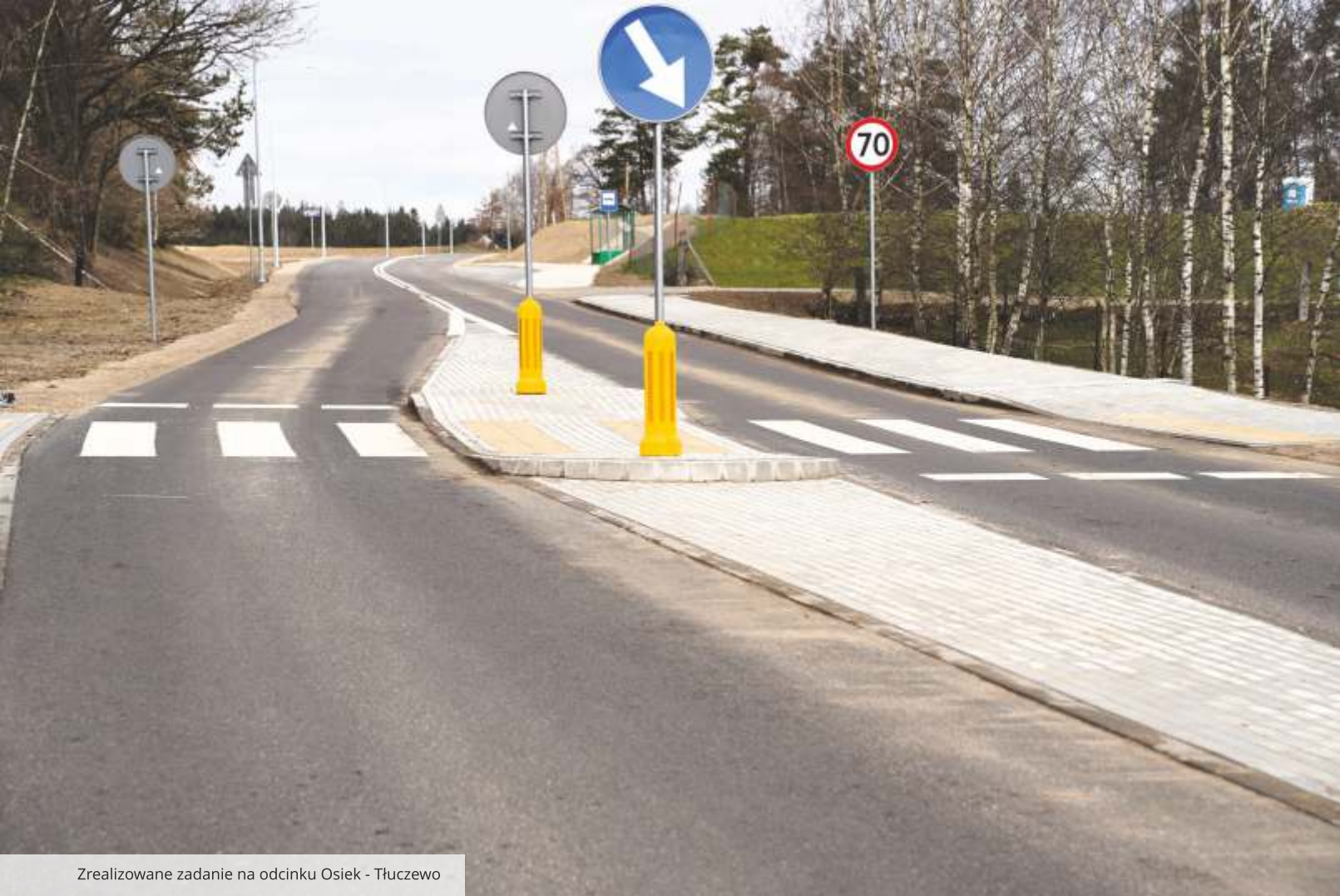
Zrealizowane zadanie na odcinku Osiek - Tłuczewo