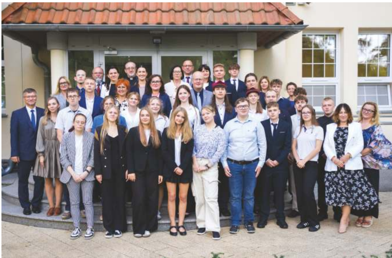
Młodzieżowa Rada Powiatu Wejherowskiego w towarzystwie władz powiatu i dyrektorów powiatowych szkół