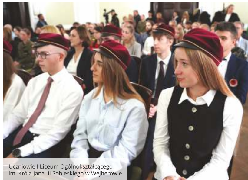
Uczniowie I Liceum Ogólnokształcącego im. Króla Jana III Sobieskiego w Wejherowie

dobre wyniki w nauce. W przypadku uczniów istotna jest także co najmniej dobra ocena z zachowania. Dodatkowo, brana jest pod uwagę aktywność naukowa, artystyczna, sportowa lub społeczna, która przyczynia się do promocji i rozwoju Powiatu Wejherowskiego.