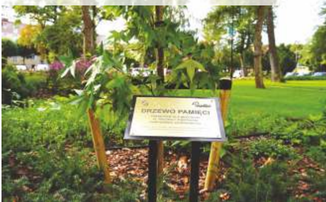
„Drzewo Pamięci” przy budynku Starostwa Powiatowego w Wejherowie