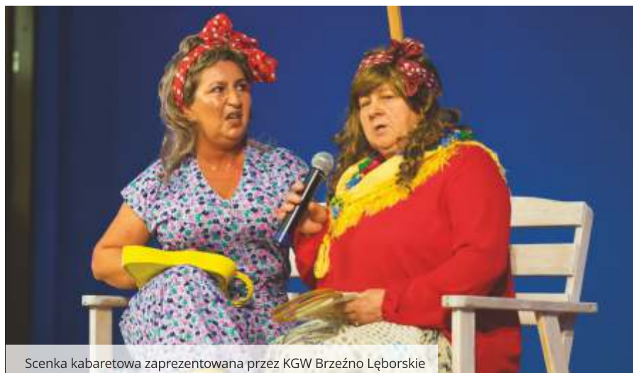
Scenka kabaretowa zaprezentowana przez KGW Brzeźno Lęborskie