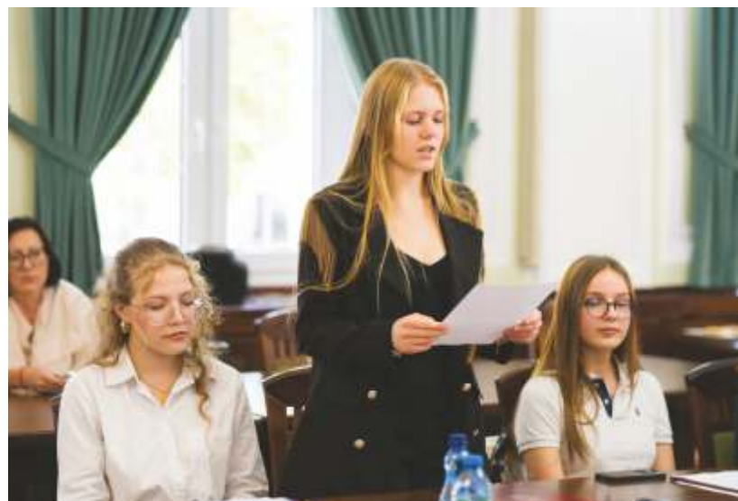
Pierwsze posiedzenie Młodzieżowej Rady Powiatu Wejherowskiego – 19.09.2025 r.

Rada daje szansę na rozwój ciekawych pomysłów oraz realny wpływ na lokalne inicjatywy.