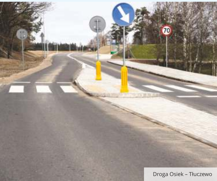
Droga Osiek – Tłuczewo

zamontowano specjalne sygnalizatory świetlne, mające na celu poprawę bezpieczeństwa wszystkich uczestników ruchu drogowego. Niedawno oddaliśmy chodnik o długości 2,4 km wzdłuż drogi powiatowej Zakrzewo – Linia oraz 300-metrowy odcinek chodnika w Bojanie. W trakcie realizacji jest montaż sygnalizacji w Kostkowie w Gminie Gniewino. Zamierzamy dalej kontynuować projekty mające na celu poprawę bezpieczeństwa pieszych. Wśród planowanych inwestycji jest m.in. powstanie sygnalizacji przy szkole w Nowym Dworze Wejherowskim i w Koleczkowie, budowa chodnika i przejścia dla pieszych w Strzebielinku czy poprawa bezpieczeństwa skrzyżowań w Wejherowie u zbiegu ulic Sikorskiego – Myśliwska oraz Chopina – Partyzantów.