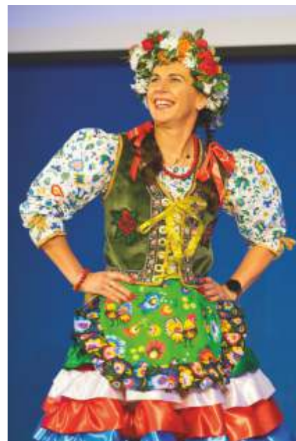
Stylizacja inspirowana folklorem przygotowana przez KGW Bolszewo

Organizatorami wydarzenia byli Pomorski Ośrodek Doradztwa Rolniczego w Lubaniu, Powiatowy Zespół Doradztwa Rolniczego, Gmina Gniewino oraz Starostwo Powiatowe w Wejherowie.