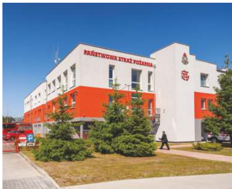
Komenda Powiatowa Państwowej Straży Pożarnej w Wejherowie, ul. Tartaczna 5

– Zakup nowoczesnego sprzętu ratowniczego to inwestycja w bezpieczeństwo wszystkich mieszkańców naszego powiatu. Otrzymane środki wesprą pracę strażaków i ratowników oraz pozwolą działać jeszcze szybciej i skuteczniej, co bezpośrednio przełoży się na poprawę ochrony życia i zdrowia lokalnej społeczności – podkreślił Starosta Wejherowski Marcin Kaczmarek .