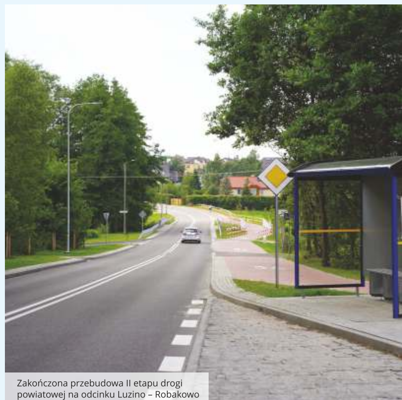
Zakończona przebudowa II etapu drogi powiatowej na odcinku Luzino – Robakowo

Rozwój infrastruktury drogowej i transportowej to filary sprawnego funkcjonowania regionu. Nie zamierzamy zwalniać tempa, w planach są kolejne inwestycje, które odpowiadają na potrzeby mieszkańców. Warto jednak zaznaczyć, że zakres i szybkość realizacji poszczególnych zadań w dużej mierze uzależnione są, jak już to wcześniej zaznaczyłem, od możliwości pozyskania zewnętrznego finansowania. Jesteśmy aktywni w tym zakresie i sięgamy zarówno po środki rządowe, jak i unijne. W nadchodzących latach część projektów będzie również finansowana z tzw. funduszy jądrowych, związanych z budową pierwszej elektrowni jądrowej w naszym powiecie. W ramach rządowego programu wspierania inwestycji samorządowych przewidziano 72 mln zł na zadania infrastrukturalne na terenie powiatu wejherowskiego. To ogromna szansa na rozwój – szczególnie w obszarach, które znajdują się w zasięgu oddziaływania tej strategicznej inwestycji. Dzięki temu poprawi się zarówno bezpieczeństwo, jak i codzienny komfort życia mieszkańców.