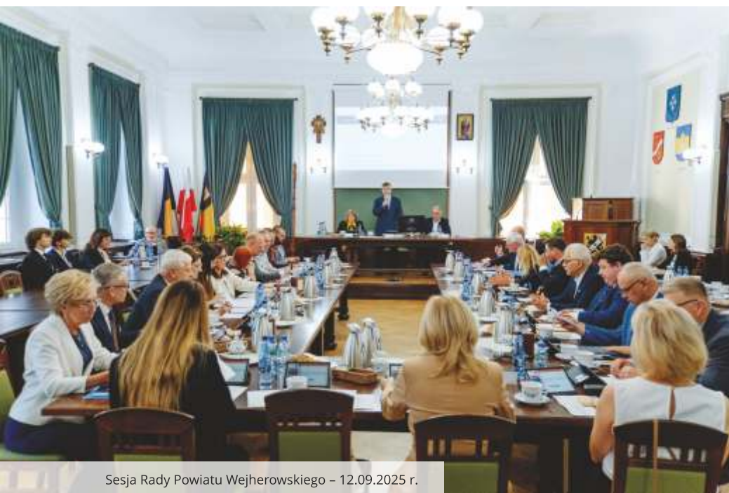
Sesja Rady Powiatu Wejherowskiego – 12.09.2025 r.