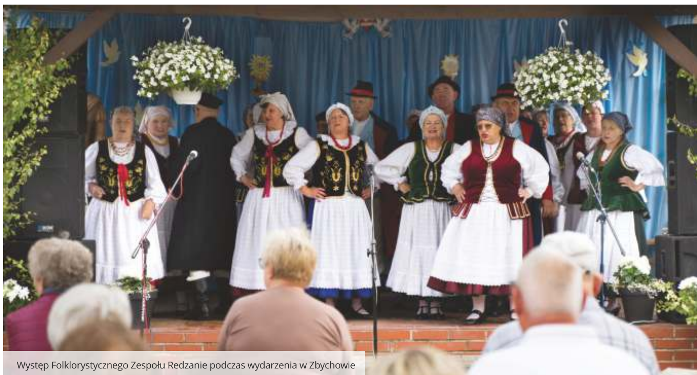
Występ Folklorystycznego Zespołu Redzanie podczas wydarzenia w Zbychowie

To był niezwykle czas pełen pasji, pozytywnej energii i zaangażowania. Dziękujemy wszystkim mieszkańcom powiatu, organizatorom i partnerom wydarzeń - to dzięki Wam lato w Powiecie Wejherowskim ma niepowtarzalny charakter.