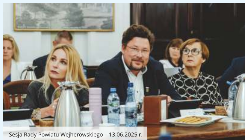
Sesja Rady Powiatu Wejherowskiego – 13.06.2025 r.

W 2024 r. na realizację zadań z zakresu pomocy społecznej przeznaczono ponad 60 mln zł. Jednym z kluczowych obszarów była piecza zastępcza – na ten cel wydatkowano blisko 24,7 mln zł. Środki te zostały przeznaczone na zapewnienie odpowiednich warunków życia dzieciom przebywającym w rodzinach zastępczych oraz placówkach opiekuńczo-wychowawczych. Pokryły one m.in. koszty wynagrodzeń dla rodzin zastępczych, bieżącego funkcjonowania placówek oraz wsparcia procesu usamodzielniania się wychowanków. Dużą część budżetu, bo ponad 27,4 mln zł, przeznaczono na całodobową opiekę w domach pomocy społecznej. Finansowanie to objęło zapewnienie komplek-