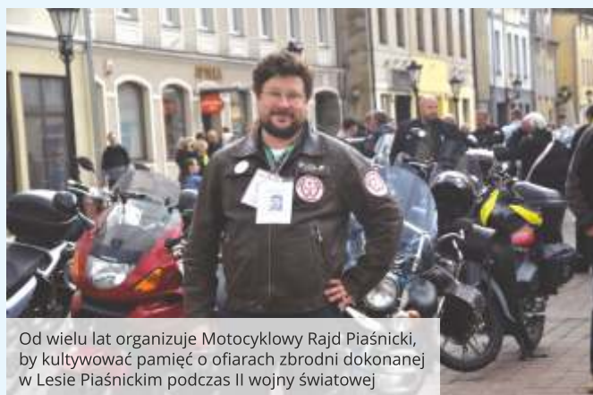
Od wielu lat organizuje Motocyklowy Rajd Piaśnicki, by kultywować pamięć o ofiarach zbrodni dokonanej w Lesie Piaśnickim podczas II wojny światowej

Jednocześnie obserwujemy dynamicznie zmieniające się potrzeby społeczne. Społeczeństwo się starzeje, co powoduje wzrost zapotrzebowania na różnorodne formy wsparcia – zarówno dla seniorów, jak i osób wymagających specjalistycznej opieki. Jednocześnie rosną oczekiwania co do jakości świadczonych usług – mieszkańcy chcą mieć dostęp do nowoczesnej, efektywnej i dostosowanej do indywidualnych potrzeb pomocy. Wobec tych wyzwań konieczne jest nieustanne poszukiwanie innowacyjnych rozwiązań, które pozwolą skutecznie odpowiadać na nowe realia. Kluczową rolę odgrywają inwestycje w rozwój infrastruktury oraz profesjonalizację kadry. Przy ograniczonych środkach własnych, istotne staje się również skuteczne pozyskiwanie funduszy zewnętrznych, umożliwiających realizację nowych projektów i programów. System pomocy społecznej musi wykazywać się elastycznością i gotowością do szybkiego reagowania na pojawiające się problemy. Tylko w ten sposób możliwe jest realne wsparcie osób w trudnej sytuacji życiowej oraz budowanie społeczności opartych na solidarności i wzajemnej pomocy.