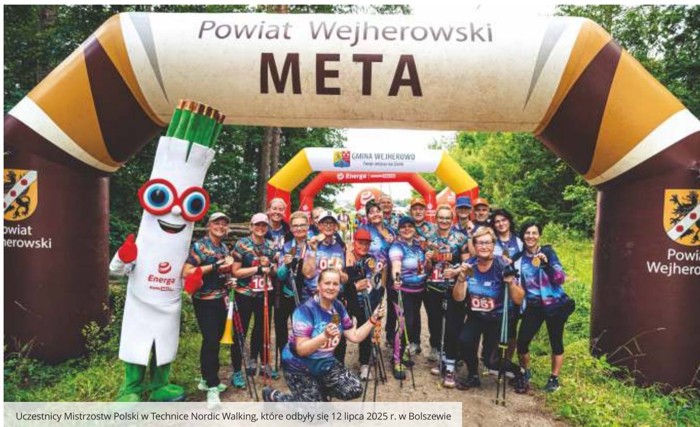
Uczestnicy Mistrzostw Polski w Technice Nordic Walking, które odbyły się 12 lipca 2025 r. w Bolszewie