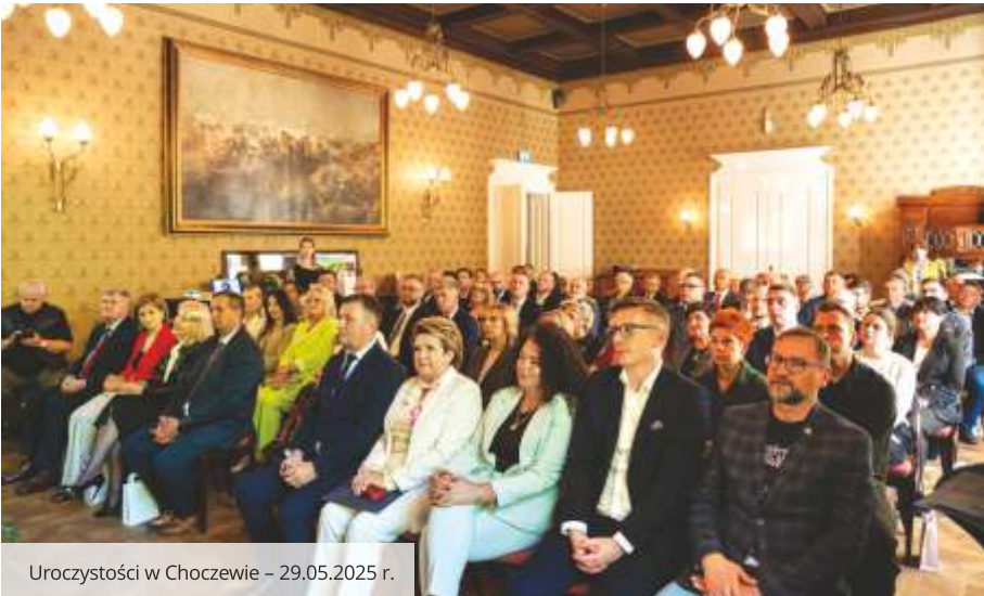
Uroczystości w Choczewie – 29.05.2025 r.